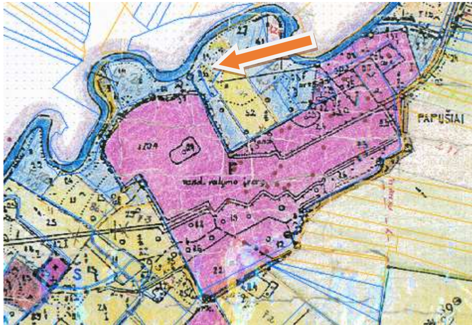
Ištrauka iš Molainių kadastro vietovės žemės reformos žemėtvarkos projekto.

Žemės sklypo ribų formavimas atliktas vadovaujantis Panevėžio rajono savivaldybės teritorijos bendroju planu, patvirtintu 2008 m. liepos 3 d. sprendimu Nr. T-154, Molainių kadastro vietovės žemės reformos žemėtvarkos projektu (patvirtintas Panevėžio apskrities viršininko 2000 m. kovo 21 d. įsakymu Nr. 415Ž) bei jo papildymais, gretimų sklypų kadastrinių/preliminarių matavimų duomenimis.