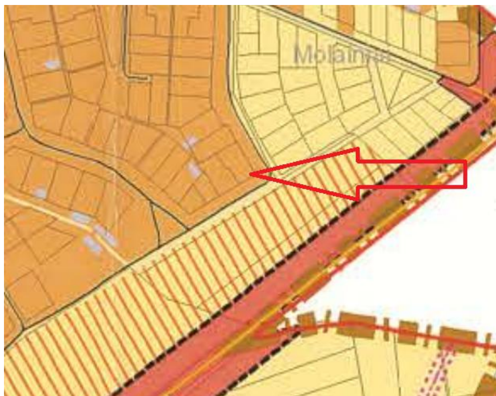
5pav. Ištrauka ir Panevėžio rajono aplinkkelio intensyvios plėtros teritorijos nuo Panevėžio miesto iki magistralinio kelio (VIA BALTICA) A9/272 specialiojo plano.