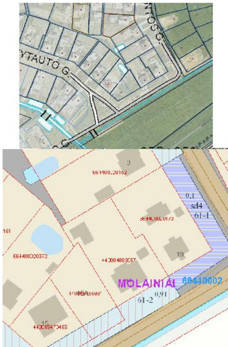
3pav. Ištrauka iš Panevėžio rajono Molainių kadastro vietovės žemės reformos žemėtvarkos projektų

Pagal Panevėžio rajono bendrojo plano sprendinius žemės sklypai patenka į užstatytą teritoriją. Gyvenamųjų namų teritorijos žemė gali būti naudojama gyvenamiems namams statyti, smulkaus ir vidutinio verslo ir viešųjų paslaugų (švietimo, sveikatos, sporto) patalpoms įrengti arba statiniams statyti, bendro naudojimo želdynams ir inžineriniams tinklams, įrenginiams statyti ir eksploatuoti. Mažaaukščio užstatymo intensyvumas neturi būti didesnis kaip 3a., užstatymo intensyvumo rodikliai neturi viršyti gyvenamosios paskirties sklypams – 0,4. Naujų namų valdos sklypams kaimo vietovėje turi būti ne mažesnės nei 9 arai.