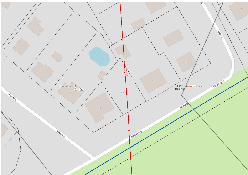
4pav. Ištrauka iš Panevėžio rajono teritorijų planavimo žemėlapiu (melioracija)