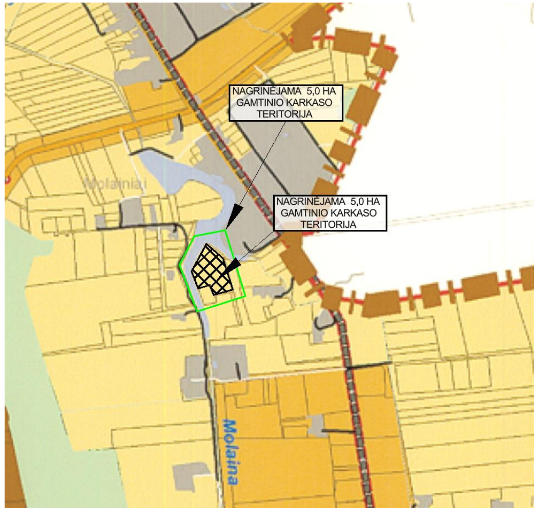
3 pav. Panevėžio aplinkkelio intensyvios plėtros teritorijos nuo Panevėžio miesto iki magistralinio kelio (VIA BALTICA) A9/272 specialusis planas Panevėžio rajono savivaldybės teritorijoje brėžinio fragmentas su nagrinėjamos gamtinio karkaso teritorijos situacija.

Aiškinamasis raštas. Teritorijų planavimo dokumento Nr. K-VT- 66-24-542.