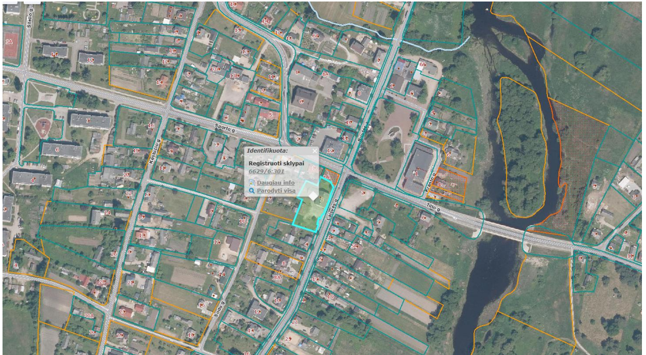
Ištrauka iš Panevėžio rajono savivaldybės teritorijos bendrojo plano, patvirtinto Panevėžio rajono savivaldybės tarybos 2008 m. liepos 3 d. sprendimu Nr. T-154.