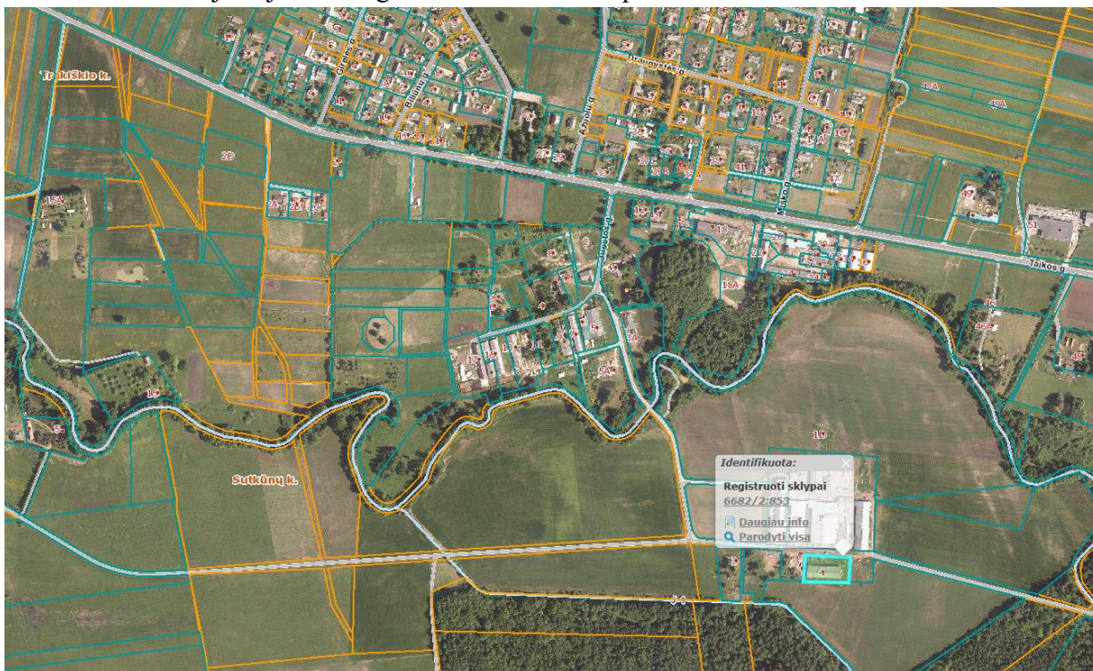
Ištrauka iš Nekilnojamojo turto registro kadastro žemėlapis