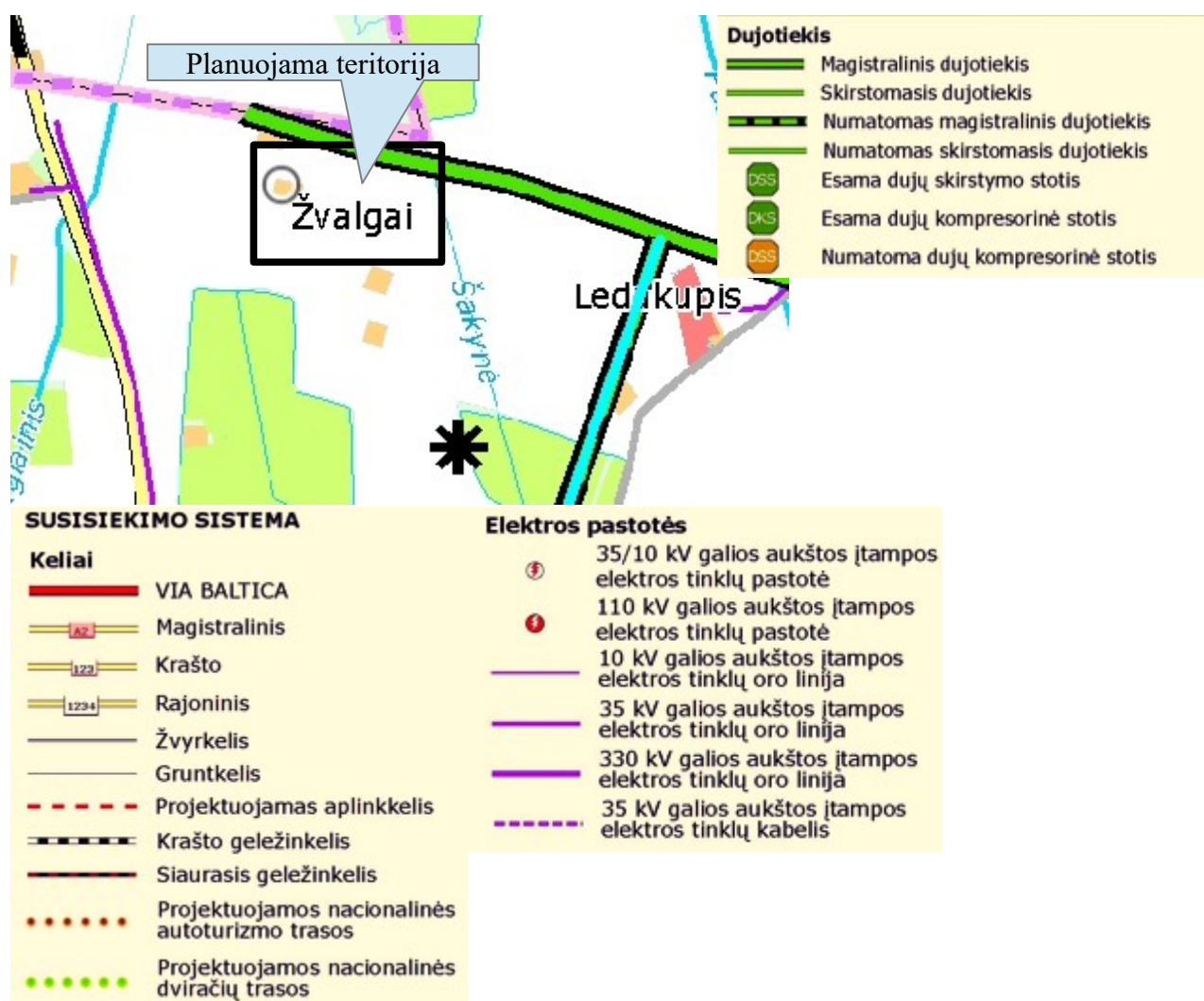
2 pav. Ištrauka iš Panevėžio rajono savivaldybės teritorijos bendrojo plano (reg. Nr. 000661001024). Inžinerinė infrastruktūras ir susisiekimas.