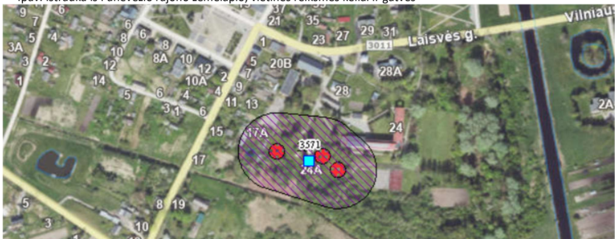
5pav. Ištrauka iš požeminio vandens vandenviečių su VAZ ribomis žemėlapiu ( https://www.lgt.lt/ )