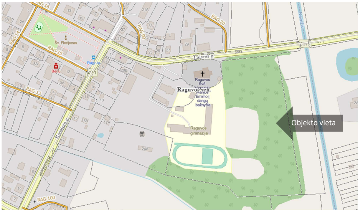
4pav. Ištrauka iš Panevėžio rajono žemėlapiu, vietinės reikšmės keliai ir gatvės