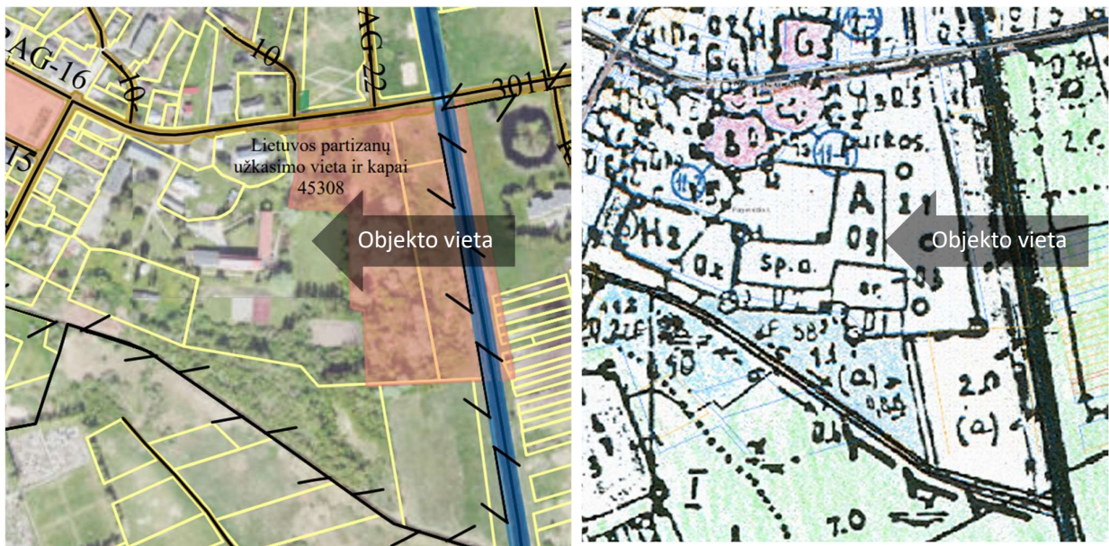
3pav. ištraukos iš Panevėžio rajono Raguvos kadastro vietovės žemės reformos žemėtvarkos projektu