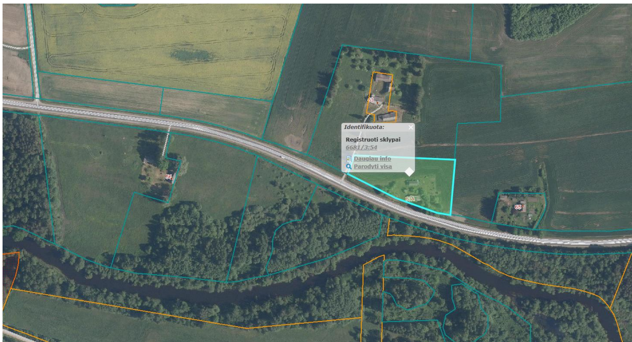
Ištrauka iš Panevėžio rajono savivaldybės teritorijos bendrojo plano, patvirtinto Panevėžio rajono savivaldybės tarybos 2008 m. liepos 3 d. sprendimu Nr. T-154.