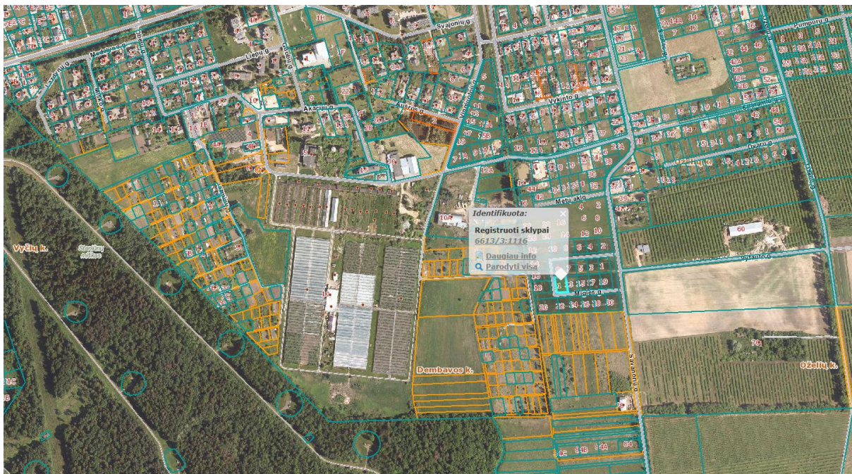
Ištrauka iš Panevėžio rajono savivaldybės teritorijos bendrojo plano, patvirtinto Panevėžio rajono savivaldybės tarybos 2008 m. liepos 3 d. sprendimu Nr. T-154.