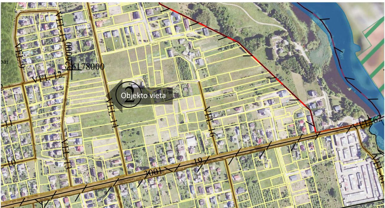
3pav. ištrauka iš Panevėžio rajono Dembavos kadastro vietovės žemės reformos žemėtvarkos projekto

Minimalus atstumas tiesiamų inžinerinių tinklų iki kaimyninio žemės sklypo ribos turi būti ne mažesnis kaip 1 metras, jei nepažeidžiami kaimyninio sklypo savininko (naudotojo) interesai. Mažinant tiesiamų inžinerinių tinklų atstumą iki kaimyninio žemės sklypo ribos, reikalingas šio sklypo savininko sutikimas raštu.