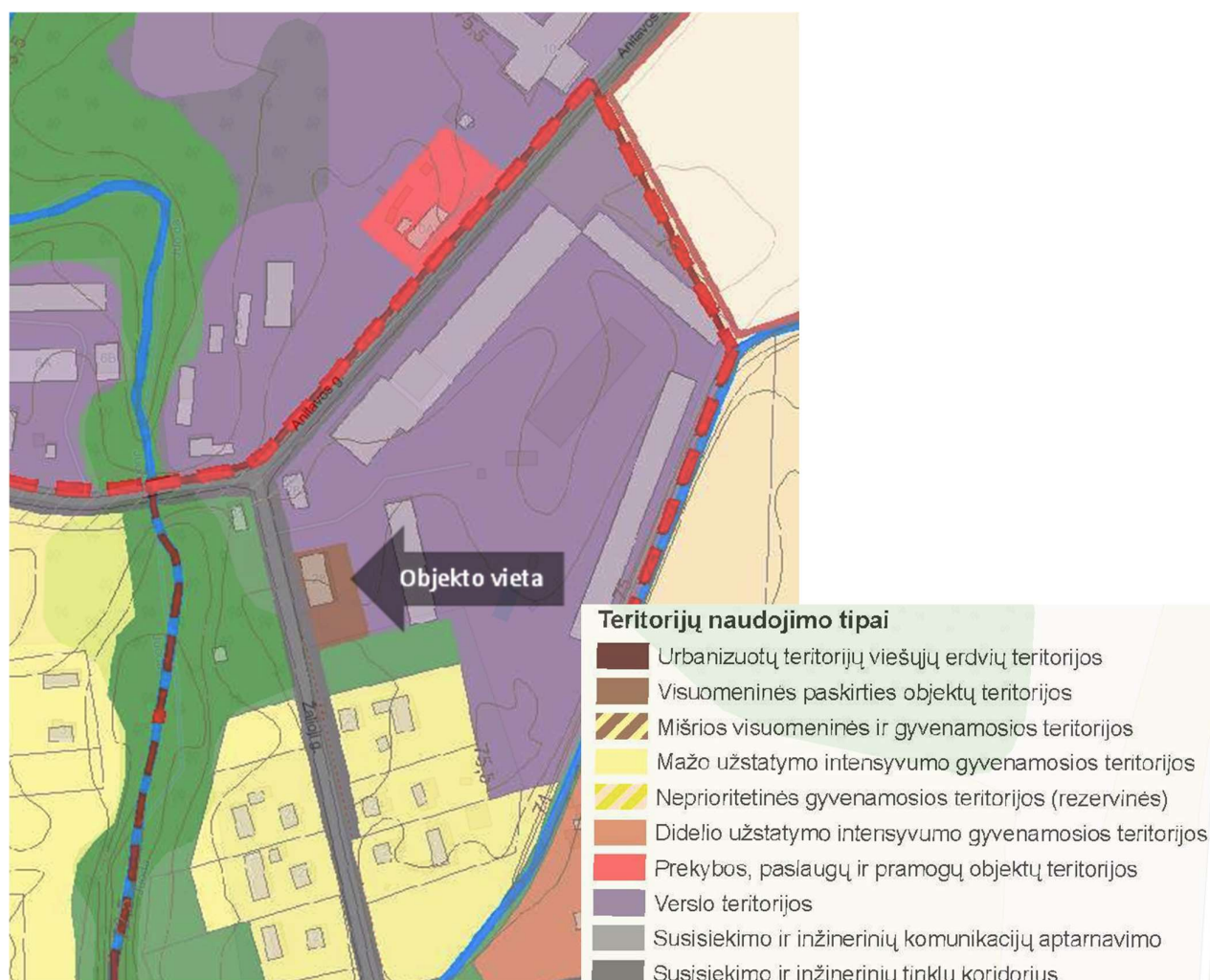
3 pav. ištrauka iš Vadoklių miestelio bendrojo plano, žemės naudojimo ir apsaugos reglamentų brėžinio

Pagal Vadoklių miestelio bendrojo plano sprendinius sklypas patenka į visuomeninės paskirties objektų teritorijas, kuriose vyrauja visuomeninės ir socialinės svarbos objektai (švietimo, medicinos, viešo administravimo). Galimos pagrindinės tikslinės žemės naudojimo paskirtys ir naudojimo būdai: kitos paskirties žemė, visuomeninės paskirties teritorijos, inžinerinės infrastruktūros teritorijos, komercinės paskirties objektų teritorijos, bendro naudojimo teritorijos, atskirųjų želdynų teritorijos. Užstatymo intensyvumas iki 1,0, aukštingumas iki 15m.