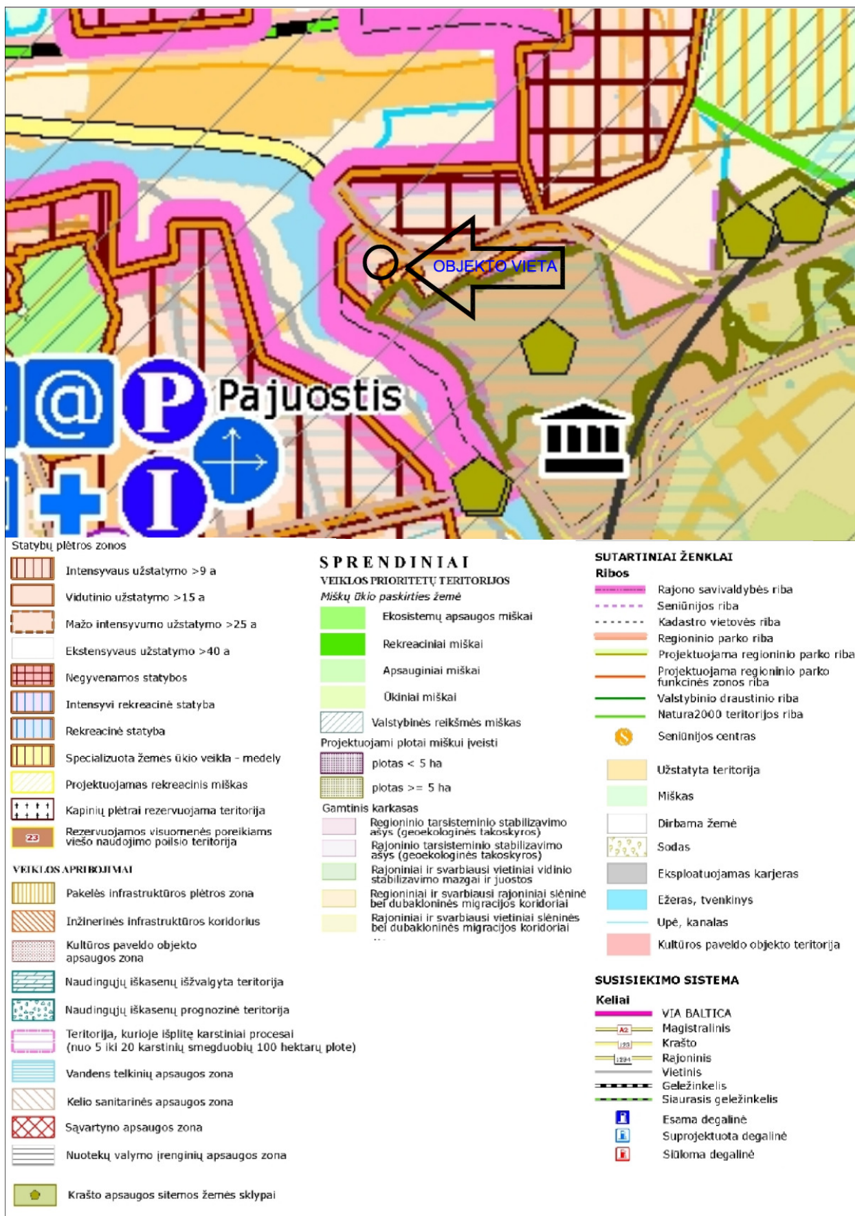
Ištrauka iš Panevėžio rajono savivaldybės teritorijos bendrojo plano brėžinio