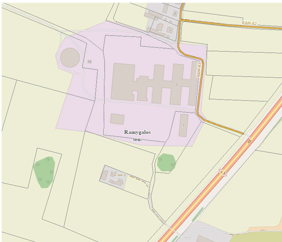
3pav. ištrauka iš Panevėžio rajono žemėlapis, vietinės reikšmės keliai ir gatvės