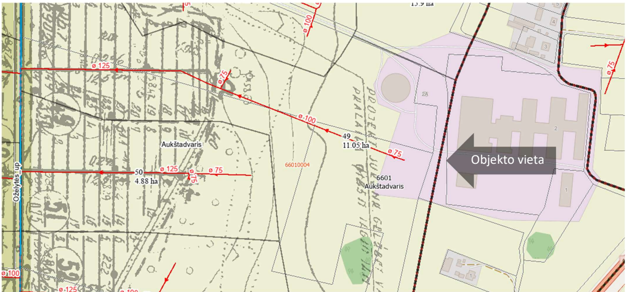
4 pav. Ištrauka iš Panevėžio rajono teritorijų planavimo žemėlapiu (melioracija)

Bendrojo naudojimo drenažo rinktuvų apsaugos zona – žemės juosta išilgai drenažo rinktuvo, kurios ribos yra po 15 metrų į abi puses nuo rinktuvo ašies. Tiksliai nustačius (atsikasus) drenažo rinktovo buvimo vietą ir suderinus su savivaldybės administracijos direktoriaus įgaliotu savivaldybės administracijos atstovu, – po 5 metrus į abi puses nuo drenažo rinktovo.