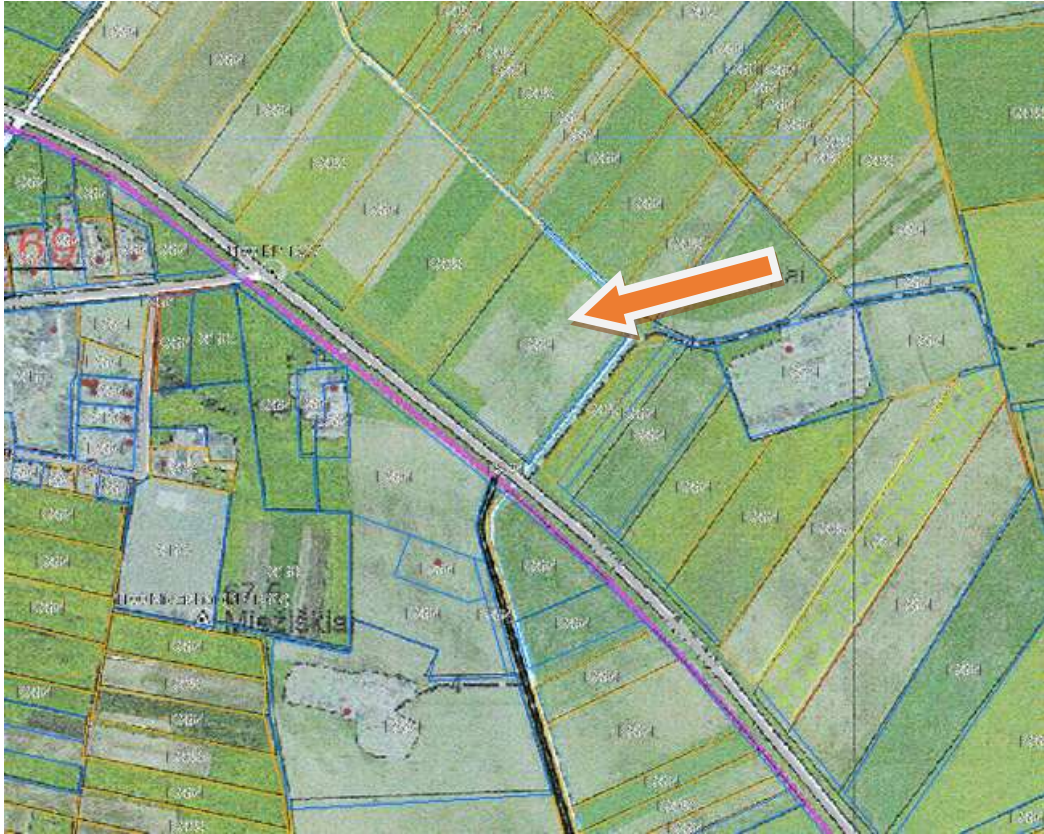
Ištrauka iš Miežiškių kadastro vietovės žemės reformos žemėtvarkos projekto.