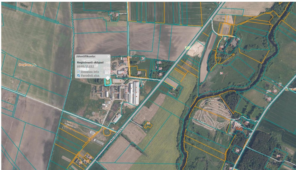
Ištrauka iš Panevėžio rajono savivaldybės teritorijos bendrojo plano, patvirtinto Panevėžio rajono savivaldybės tarybos 2008 m. liepos 3 d. sprendimu Nr. T-154.