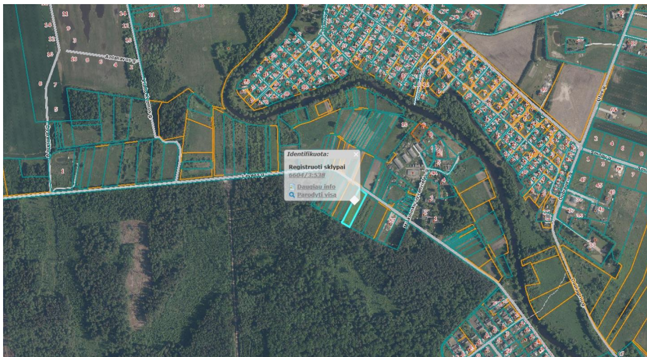
Ištrauka iš Panevėžio rajono savivaldybės teritorijos bendrojo plano, patvirtinto Panevėžio rajono savivaldybės tarybos 2008 m. liepos 3 d. sprendimu Nr. T-154.