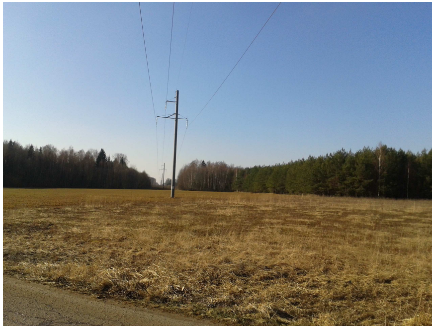
3.4.1. pav. Fotofiksacija.

Susisiekimas. Planuojama teritorija ribojasi su krašto keliu Nr. 122 Daugpilis - Kupiškis - Panevėžys. Planuojamas sklypas turi du įvažiavimus - vienas nuo krašto kelio, kitas - nuo vietinės reikšmės kelio rytuose. Prie įvažiavimų į sklypą numatomos automobilių stovėjimo aikštelės. Transporto eismo organizavimo sprendiniai tikslinami techninio projekto rengimo metu.