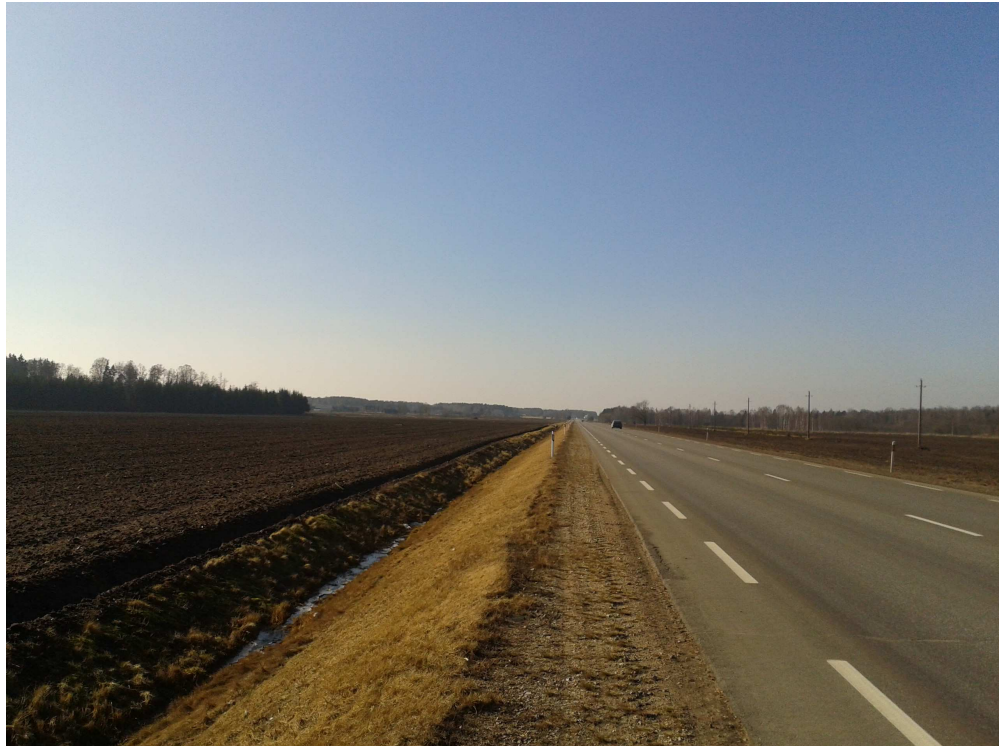
3.2.1. pav. Fotofiksacija.

Nagrinėjama - planuojama teritorija yra Kakūnų kaime, Karsakiškio seniūnijoje, Panevėžio rajono savivaldybėje, šalia krašto kelio Nr. 122 Daugpilis - Kupiškis - Panevėžys, plotas apie 21,5 ha. Atstumas nuo Panevėžio miesto iki nagrinėjamos - planuojamos teritorijos Kakūnų k. yra 15,6 km, iki Karsakiškio kaimo - 17,7 km, nuo planuojamos teritorijos iki Karsakiškio kaimo - apie 1 km. 3.2.1. pav. pateikiama krašto kelio Nr. 122 fotofiksacija (kairėje matoma planuojamos teritorijos dalis).