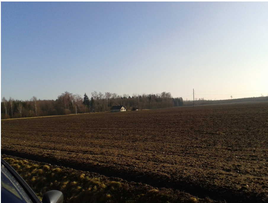
3.3.2. pav. Fotofiksacija.

Žemės sklypo suformavimo ir naudojimo būdo nustatymo miesto kapinių steigimui laisvoje valstybinėje žemėje Kakūnų k., Karsakiškio sen., Panevėžio r. detalūs planas. Esama būklė. Konceptija.