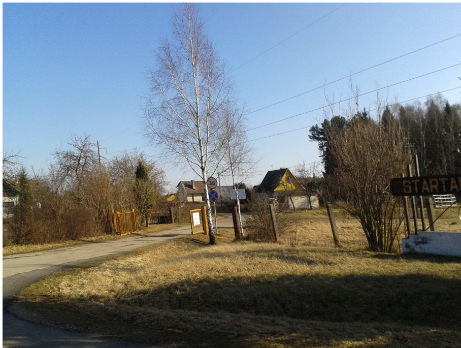
3.3.1. pav. Fotofiksacija.

Žemės sklypo suformavimo ir naudojimo būdo nustatymo miesto kapinių steigimui laisvoje valstybinėje žemėje Kakūnų k., Karsakiškio sen., Panevėžio r. detalusis planas. Esama būklė. Konceptija.