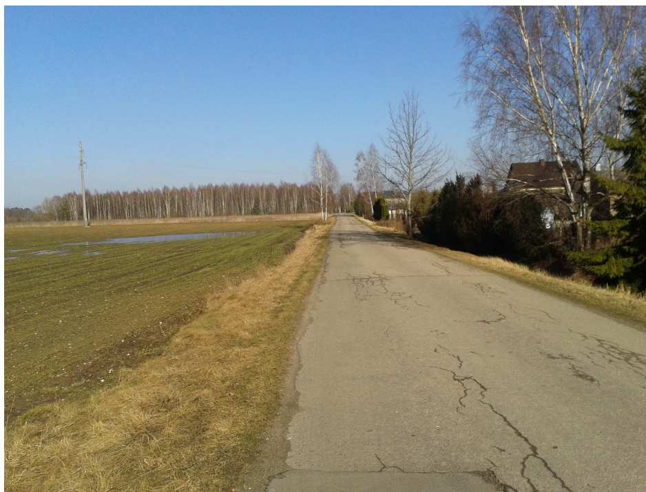
3.3.2. pav. Fotofiksacija.

Planuojamos teritorijos apsupta, maždaug už 50 m nuo planuojamos teritorijos šiaurinės pusės, yra sodyba (3.3.2. pav.).