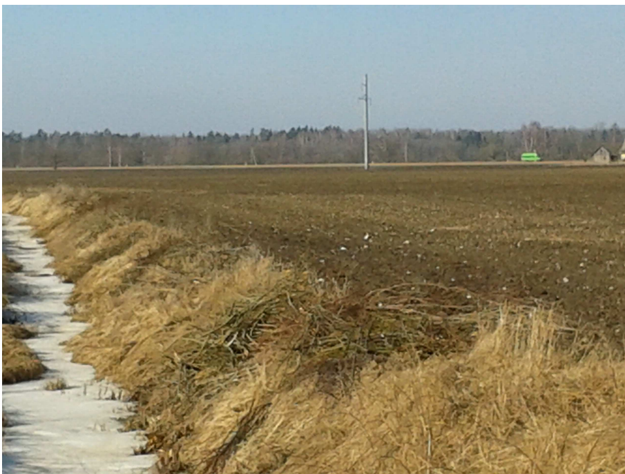
3.3.3. pav. Fotofiksacija.

Pietvakariuose teka upelis Pietupis, kurio krantai techniškai sureguliuoti (3.3.3. pav.).