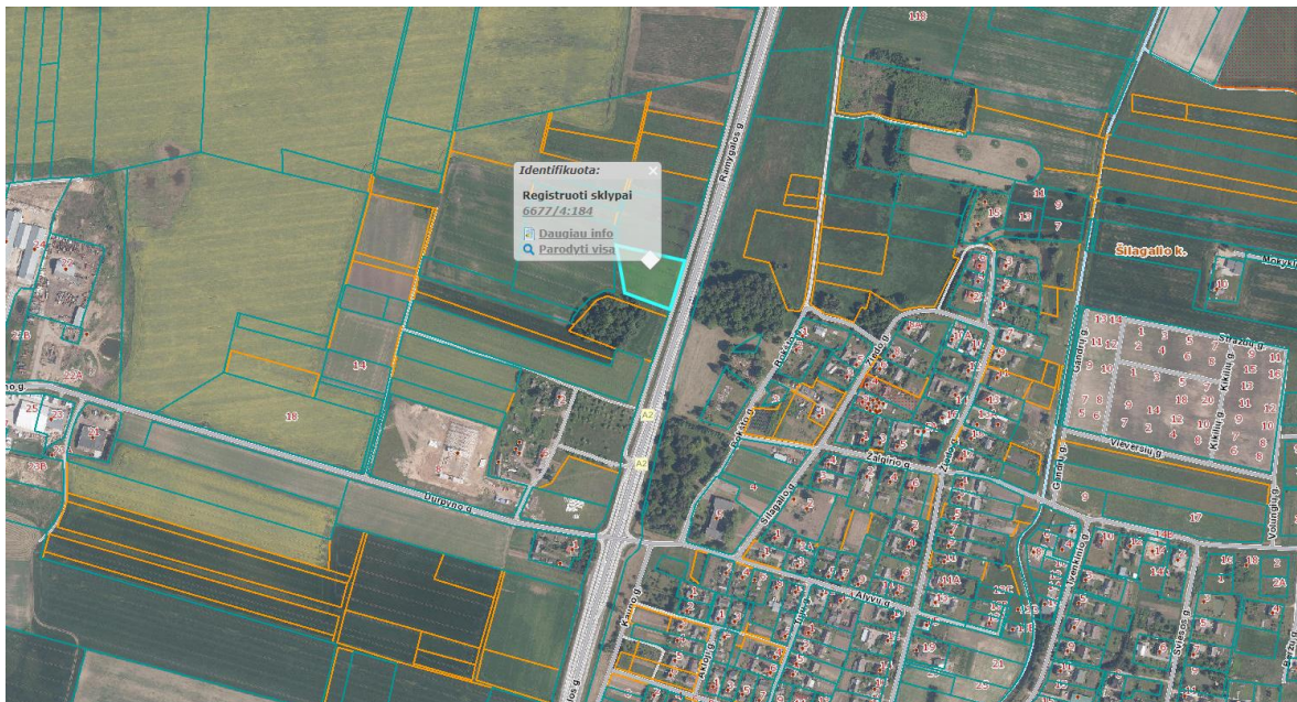
Ištrauka iš Panevėžio rajono savivaldybės teritorijos bendrojo plano, patvirtinto Panevėžio rajono savivaldybės tarybos 2008 m. liepos 3 d. sprendimu Nr. T-154.