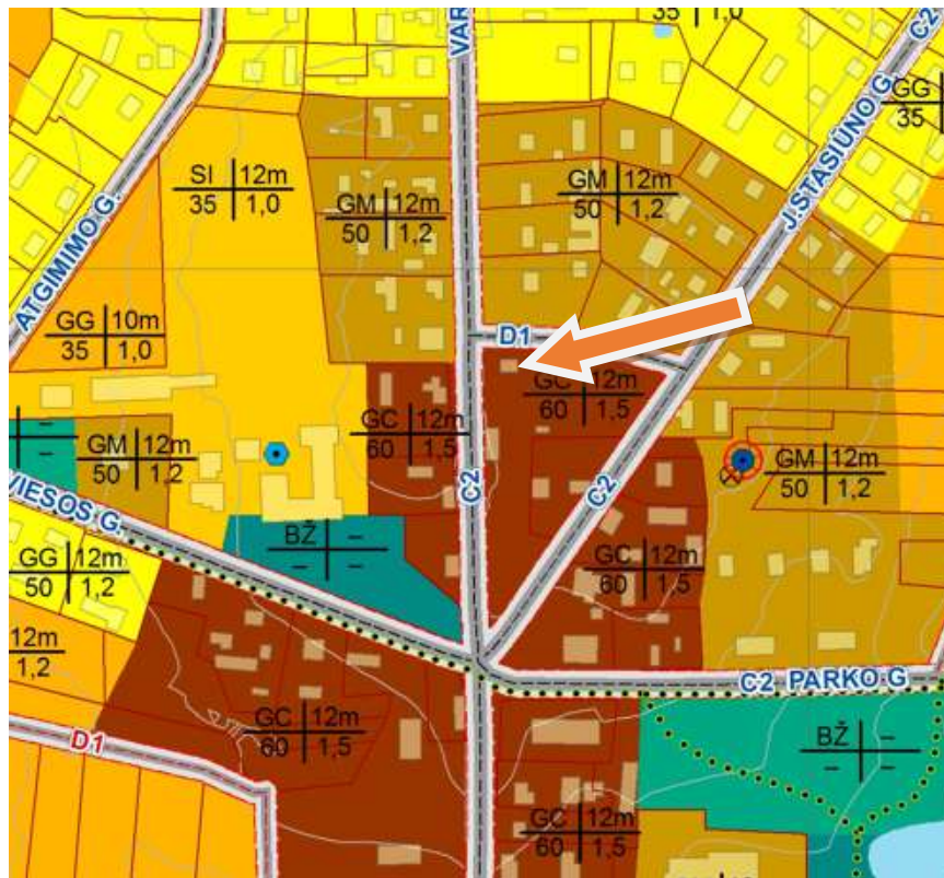
Ištrauka iš Geležiuų miestelio teritorijos bendrojo plano Žemės naudojimo ir apsaugos reglamentų brėžinys

Nagrinėjamoje teritorijoje naudingų iškasenų telkinių bei karjerų nėra.