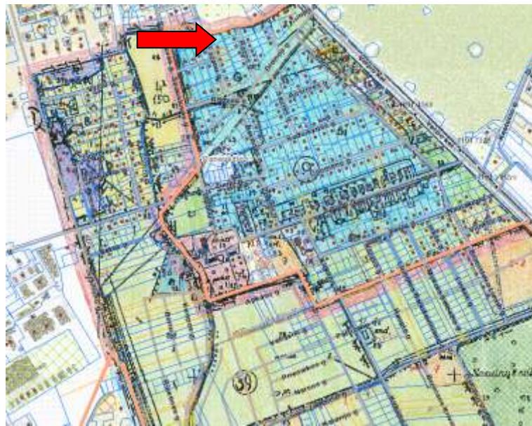
Ištrauka iš Velžio (6690) kadastro vietovės žemės reformos žemėtvarkos projekto.

Minimalus atstumas tiesiamų inžinerinių tinklų iki kaimyninio žemės sklypo ribos turi būti ne mažesnis kaip 1 metras, jei nepažeidžiami kaimyninio sklypo savininko (naudotojo) interesai. Mažinant tiesiamų inžinerinių tinklų atstumą iki kaimyninio žemės sklypo ribos, reikalingas šio sklypo savininko sutikimas raštu. Mažiausias automobilių privažiavimo plotis – 3,5 m.