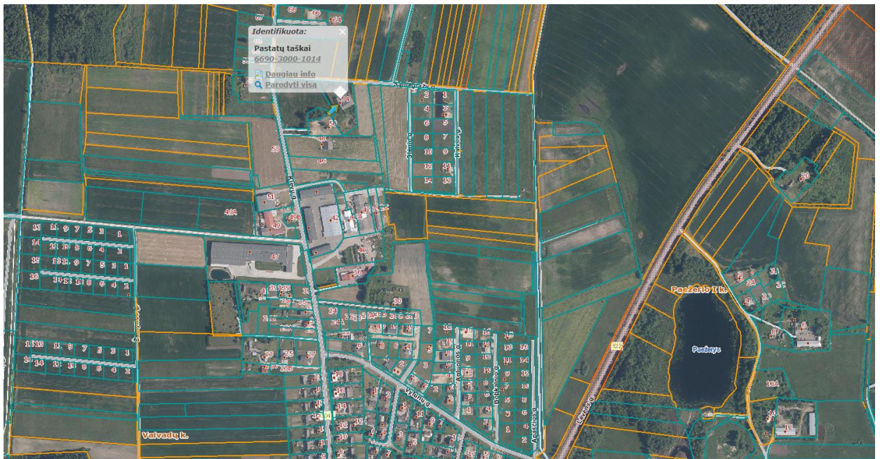
Ištrauka iš Panevėžio rajono savivaldybės teritorijos bendrojo plano, patvirtinto Panevėžio rajono savivaldybės tarybos 2008 m. liepos 3 d. sprendimu Nr. T-154.