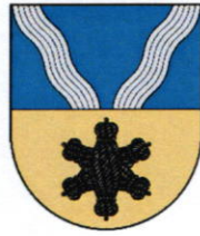
Kupiškio rajono savivaldybė