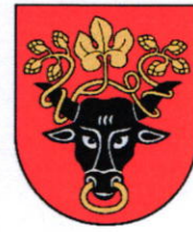
Pasvalio rajono savivaldybė