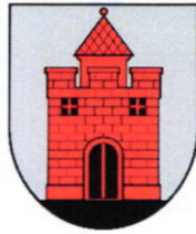
Panevėžio miesto savivaldybė