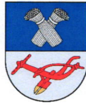
Panevėžio rajono savivaldybė