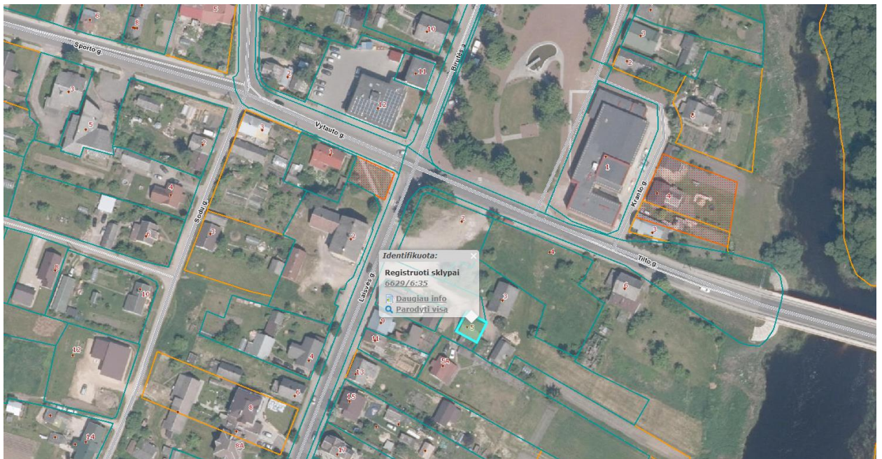
Ištrauka iš Panevėžio rajono savivaldybės teritorijos bendrojo plano, patvirtinto Panevėžio rajono savivaldybės tarybos 2008 m. liepos 3 d. sprendimu Nr. T-154.