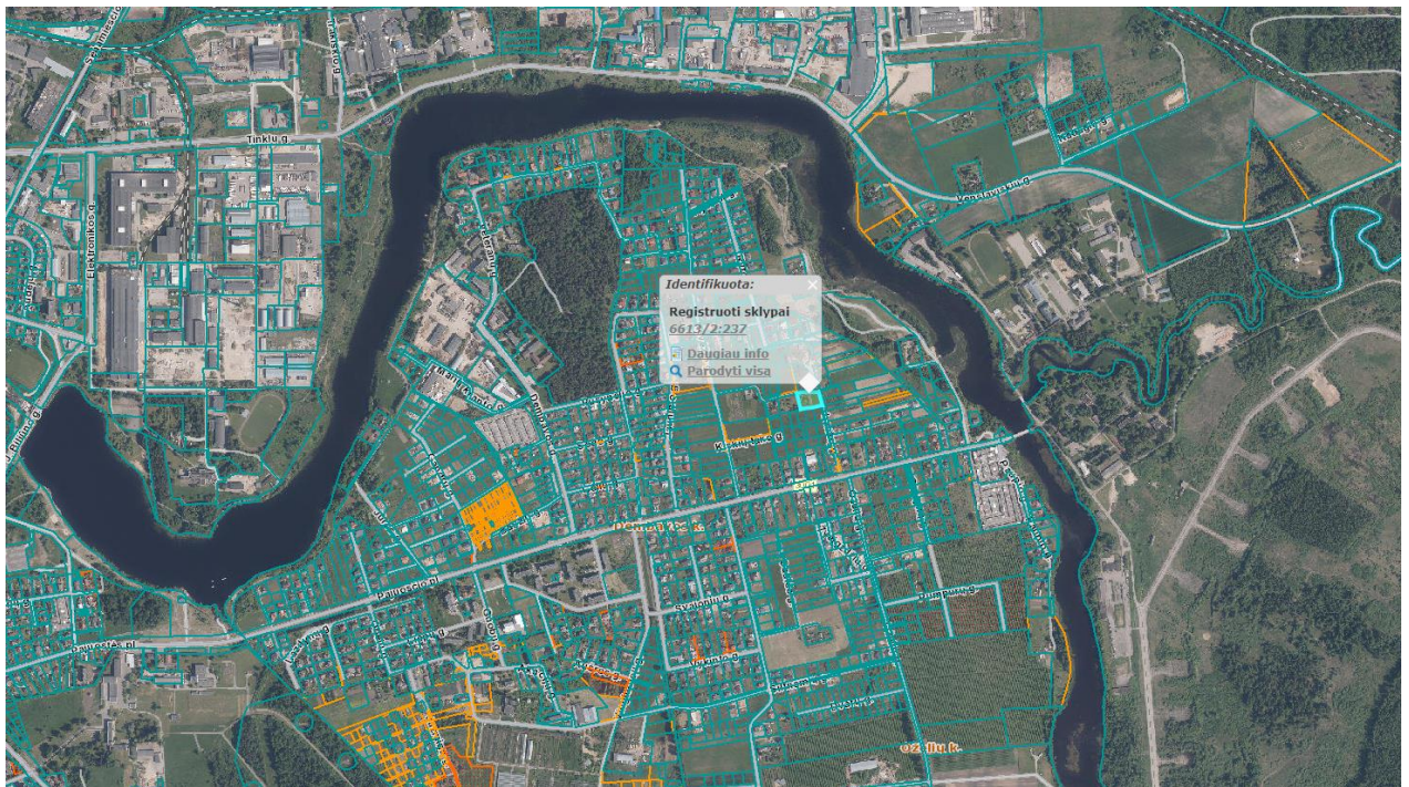
Ištrauka iš Panevėžio rajono savivaldybės teritorijos bendrojo plano, patvirtinto Panevėžio rajono savivaldybės tarybos 2008 m. liepos 3 d. sprendimu Nr. T-154.