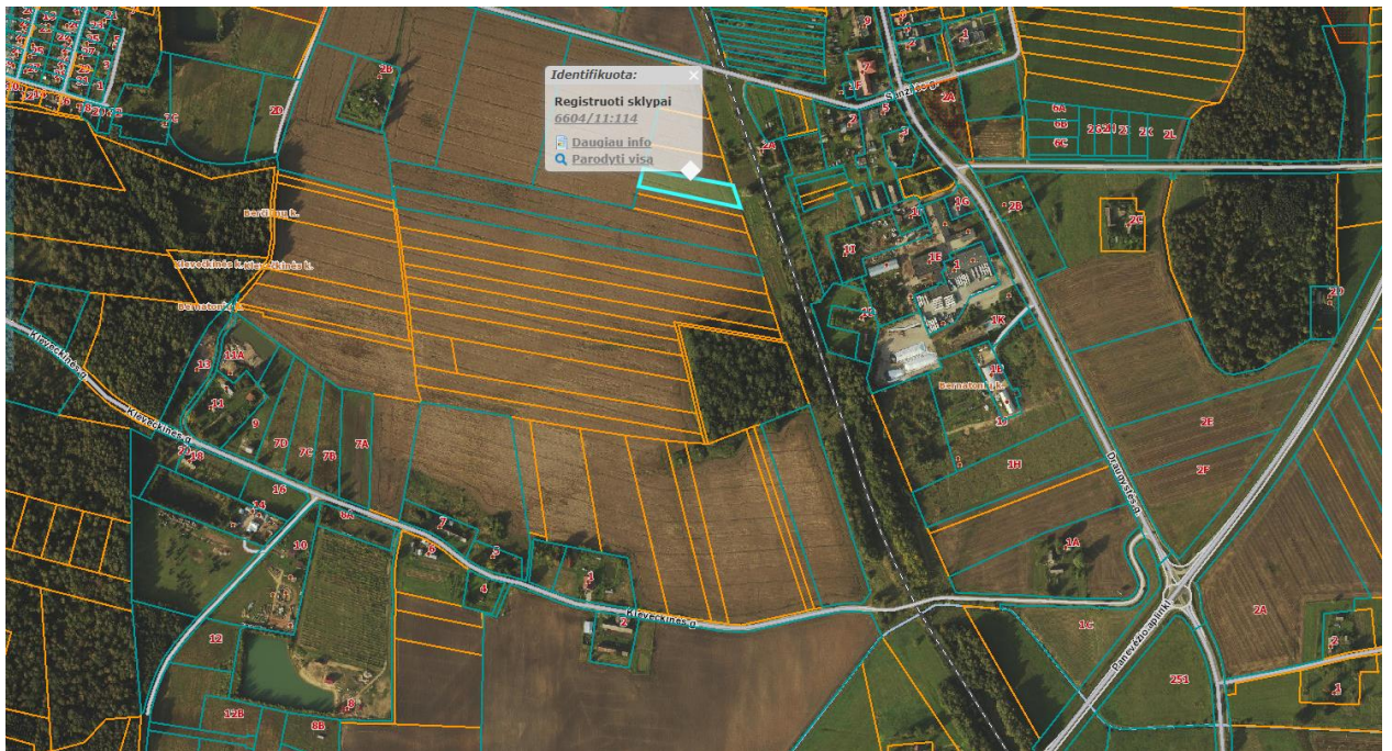
Ištrauka iš Panevėžio rajono savivaldybės teritorijos bendrojo plano, patvirtinto Panevėžio rajono savivaldybės tarybos 2008 m. liepos 3 d. sprendimu Nr. T-154.