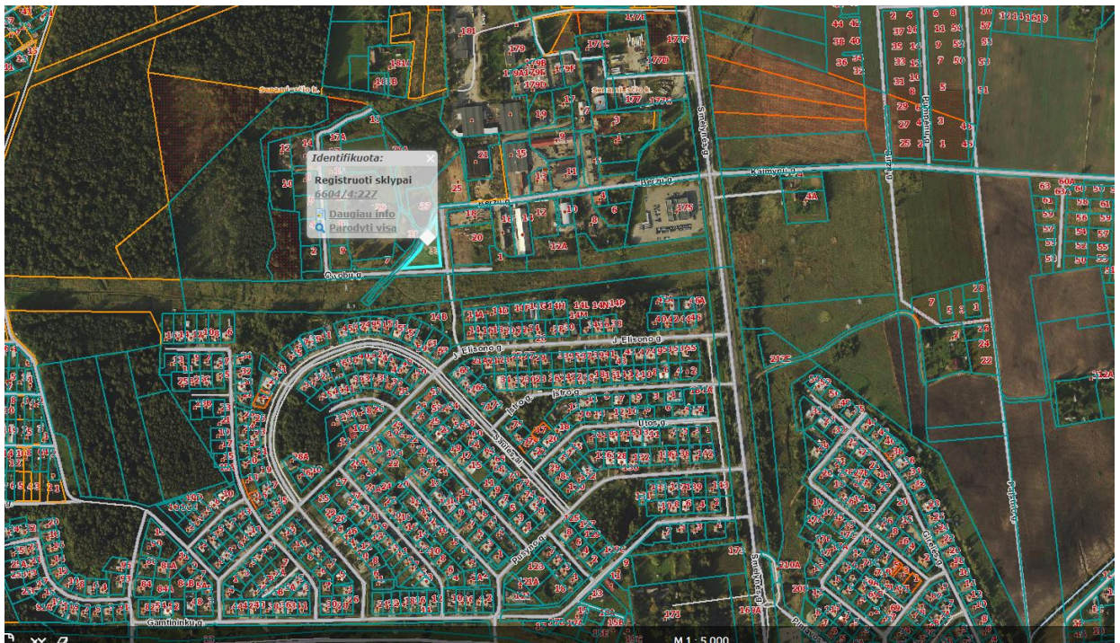
Ištrauka iš Panevėžio rajono savivaldybės teritorijos bendrojo plano, patvirtinto Panevėžio rajono savivaldybės tarybos 2008 m. liepos 3 d. sprendimu Nr. T-154.