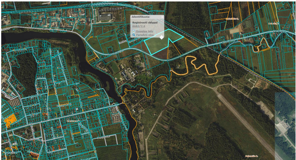
Ištrauka iš Panevėžio rajono savivaldybės teritorijos bendrojo plano, patvirtinto Panevėžio rajono savivaldybės tarybos 2008 m. liepos 3 d. sprendimu Nr. T-154.