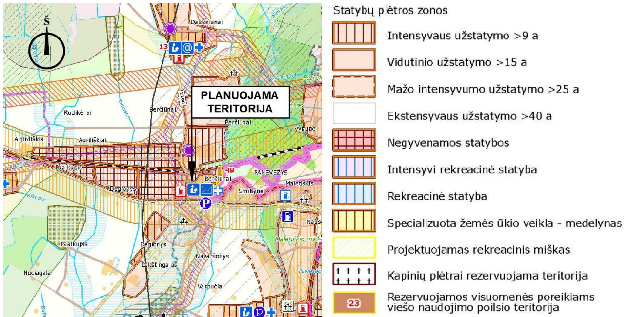
1 pav. Panevėžio rajono savivaldybės teritorijos bendrojo plano Žemės naudojimo ir apsaugos reglamentų brėžinio fragmentas su planuojamos teritorijos situacija.

Aiškinamasis raštas. Teritorijų planavimo dokumento Nr. K-VT- 66-22-147.