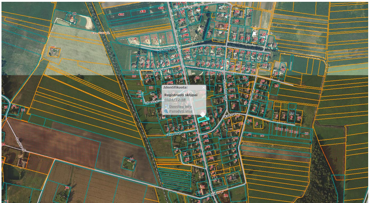
Ištrauka iš Panevėžio rajono savivaldybės teritorijos bendrojo plano, patvirtinto Panevėžio rajono savivaldybės tarybos 2008 m. liepos 3 d. sprendimu Nr. T-154.