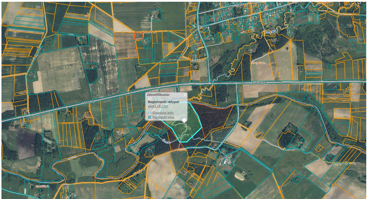
Ištrauka iš Panevėžio rajono savivaldybės teritorijos bendrojo plano, patvirtinto Panevėžio rajono savivaldybės tarybos 2008 m. liepos 3 d. sprendimu Nr. T-154.