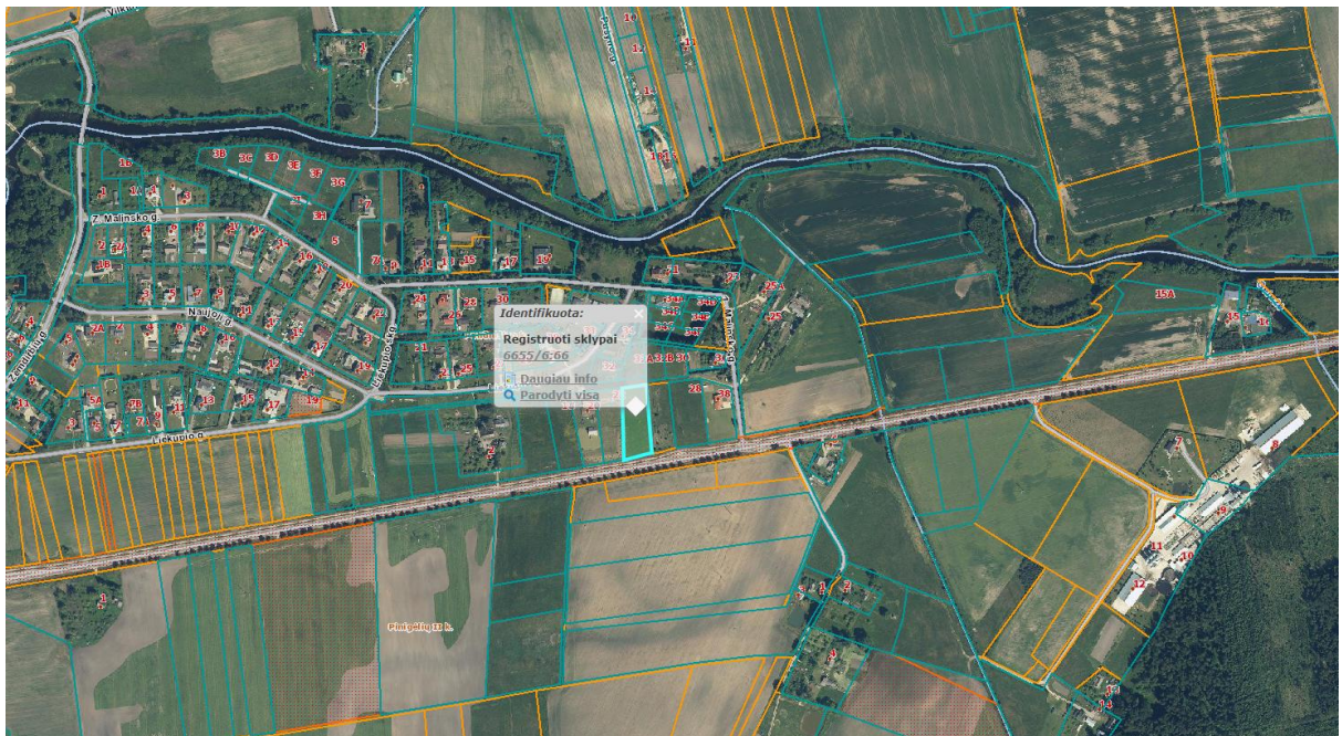
Ištrauka iš Panevėžio rajono savivaldybės teritorijos bendrojo plano, patvirtinto Panevėžio rajono savivaldybės tarybos 2008 m. liepos 3 d. sprendimu Nr. T-154.