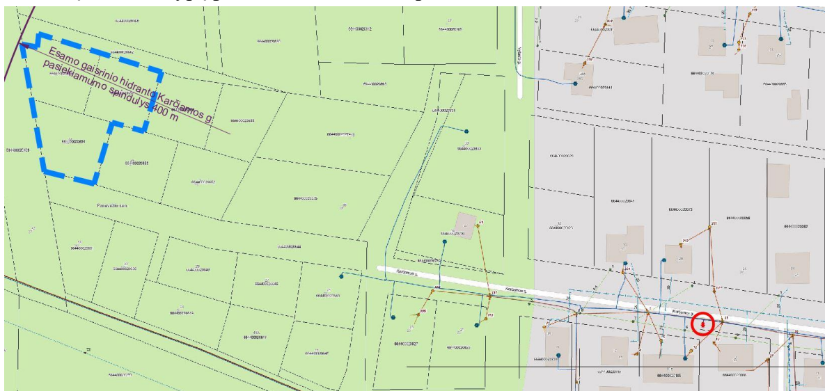
2 pav. Artimiausias gaisrinis hidrantas, planuojamos teritorijos atžvilgiu, yra už 400 m, pagrindas: inžinerinių tinklų žemėlapis.

Gaisro plitimas į gretimus pastatus ribojamas užtikrinant saugius atstumus tarp pastatų lauko sienų. Numatomiems pastatams nustatant statybos zoną, ribą ir linijas, pagal pastatams keliamus priešgaisrinių atstumų reikalavimus, leidžiama pasirinkti norminius minimalius gaisrinius atstumus, vadovaujantis Reglamentu: