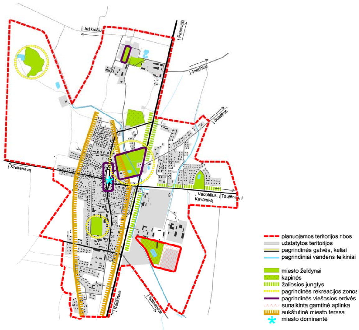
3.3 pav. Miesto žaliosios teritorijos ir jungtys

Esami gamtinio karkaso elementai yra vandens telkiniai (Upytė ir tvenkiniai) ir želdynai, kurių pagrindiniai – miesto parkas, tūkstantmečio ažuolynas, Upytės pakrantės. Sujungus esamus minėtus gamtinius elementus žaliosiomis jungtimis ne tik gerinama ekologinė miesto būklė, bet ir atveriamą galimybę plėtoti rekreaciją mieste.