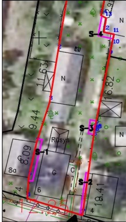
3 pav. Formuojamame žemės sklype nustatytų servitutų schema

Suformuoto žemės sklypo tikslios ribos, žemės sklypo ribų ilgiai tarp posūkio taškų, žemės sklypo plotas, specialiųjų žemės naudojimo sąlygų plotai bus nustatomi žemės sklypo kadastrinių matavimų atlikimo metu.