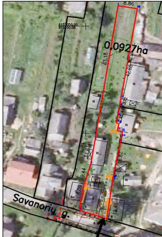
1 pav. Patekimo į naujai formuojamą žemės sklypą schema

Visa formuojamo žemės sklypo teritorija patenka į nekilnojamosios kultūros vertybės vietovės – Ramygala (unikalus objekto kodas 17101), teritoriją. Šioje kultūros paveldo vietovėje vertingosios savybės yra gatvių tinklas, aikštės planas, kapitalinio užstatymo fragmentas, miesto panorama.