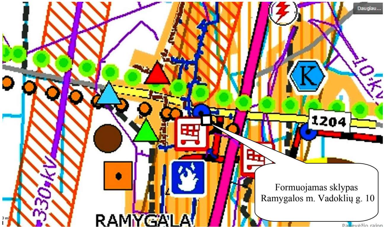
Ištrauka iš Panevėžio rajono savivaldybės teritorijos bendrojo plano.