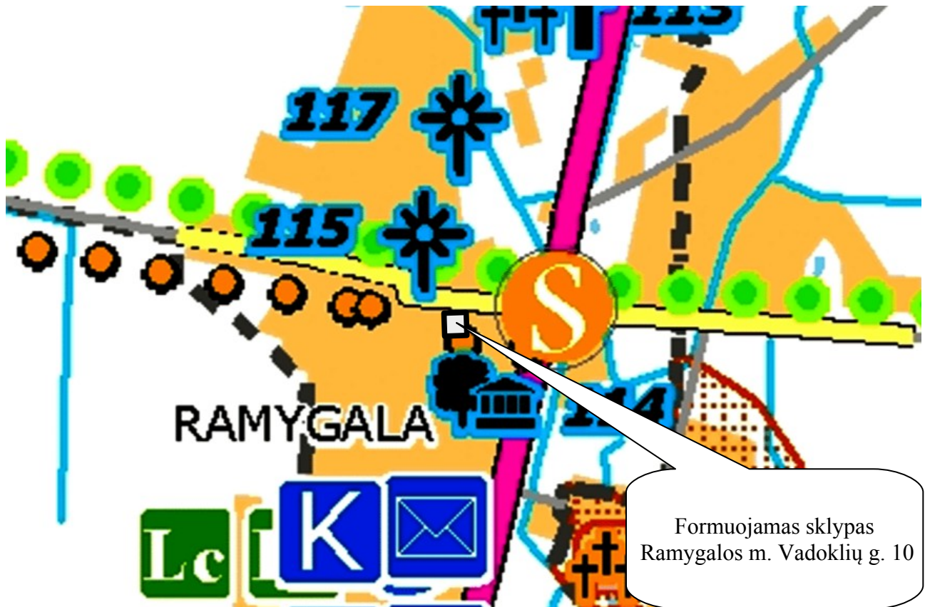
Ištrauka iš Panevėžio rajono savivaldybės teritorijos bendrojo plano. Rekreacija.