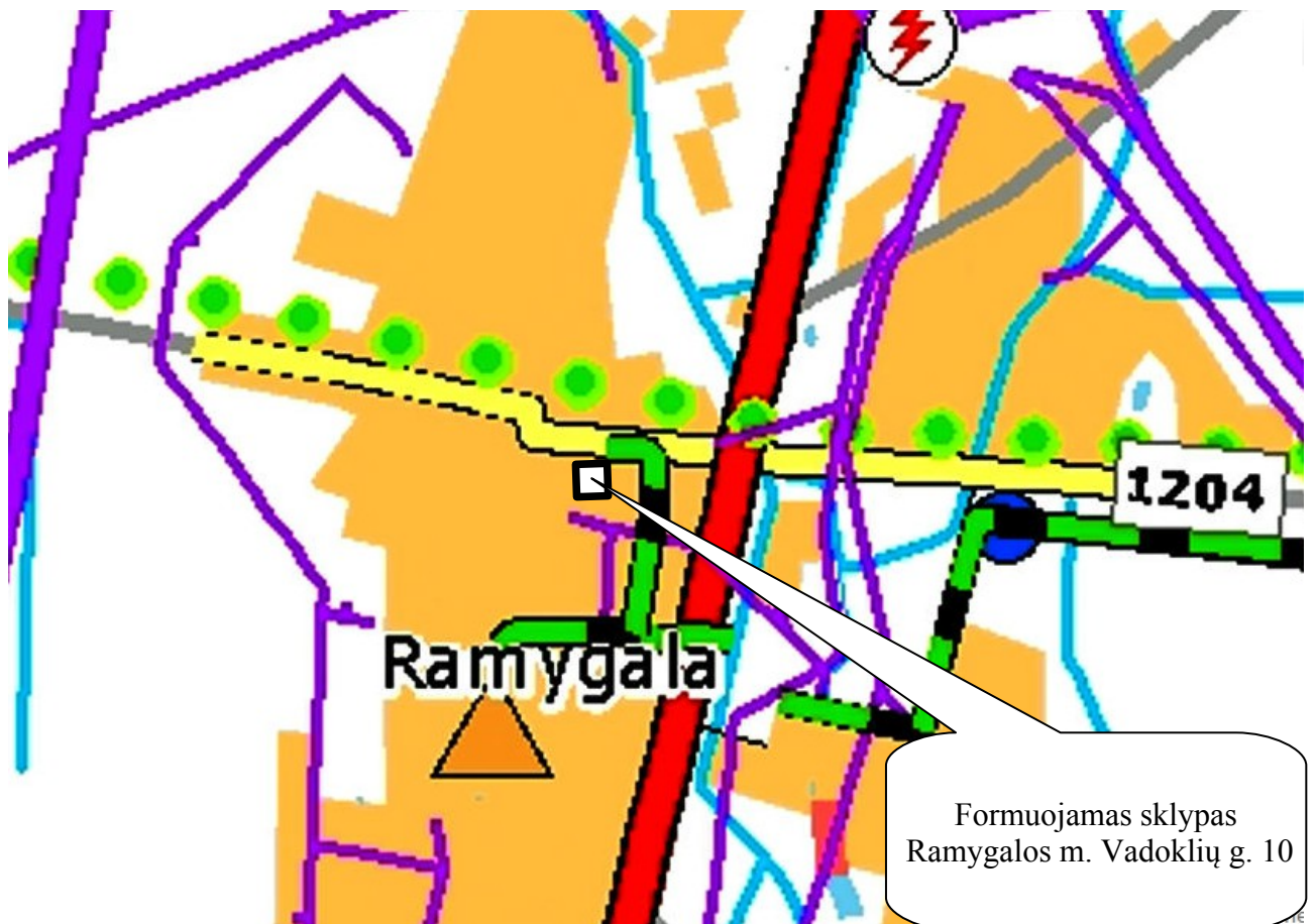
Ištrauka iš Panevėžio rajono savivaldybės teritorijos bendrojo plano. Infrastruktūra.