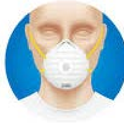
Respiratorius (FFP2, FFP3, N95)