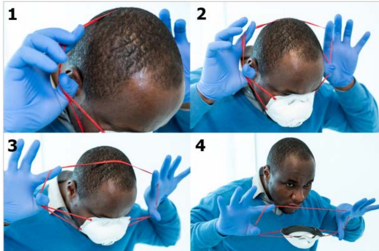
Figure 21. Removal of respirator (steps 1 through 4)